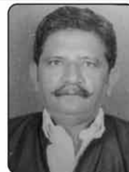
ગઢવી ખેતાભા કરમણાભા ગ્રામ પંચાયત સદસ્ય લાકડીયા